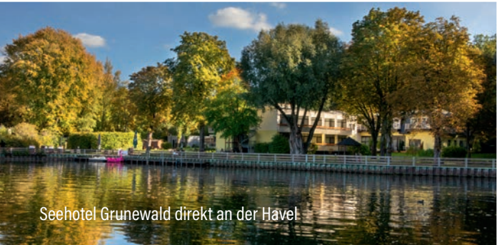
Seehotel Grunewald direkt an der Havel